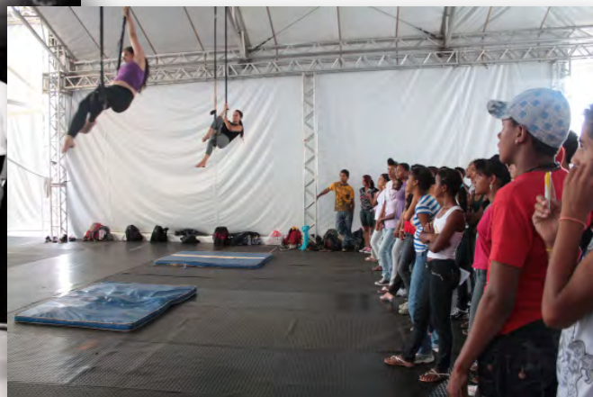
Núcleo Valores de Minas - Plug Minas.