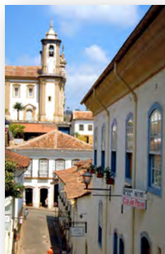
Cidade de Ouro Preto: Patrimônio Cultural da Humanidade - Minas Gerais