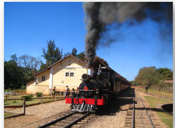
Maria Fumaça - Minas Gerais

Fonte: IBGE 2010 e Portal Brasil Escola.