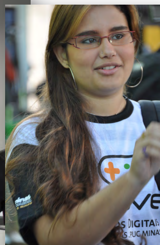
Núcleo Inove - Minas Gerais