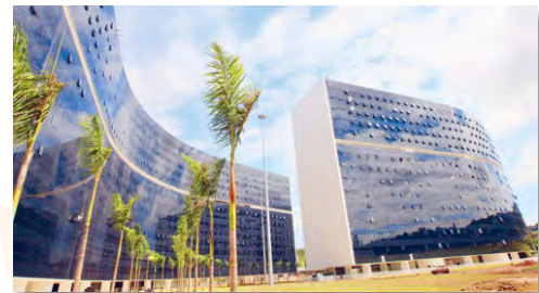
Cidade Administrativa Presidente Tancredo Neves - Minas Gerais.