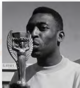
Pelé - Jogador de Futebol do Século XX pela FIFA.

Nestes termos, não é difícil imaginar os reflexos de evento de tal magnitude no Brasil, conhecido como “o país do futebol”, como será em 2014. Acordados com a FIFA 7 , a federação internacional de futebol, foram definidas 13 cidades sedes no país, em que serão realizados jogos em conformidade aos grupos sorteados. Assim, serão estas mais atrativas para receber turistas nacionais e internacionais, recebendo mais divisas e pessoas em seus hotéis, suas lojas, restaurantes, museus, parques, sendo necessário, portanto, representativos investimentos em infra-estrutura de um modo geral.