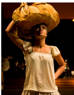
Núcleo Valores de Minas - Minas Gerais

Núcleo Valores de Minas: O Núcleo Valores de Minas é uma iniciativa do SERVAS que busca, desde 2005, promover a construção e/ou resgate da cidadania e a inclusão social de jovens, bem como promover seu desenvolvimento cultural e artístico, mediante a experiência direta da arte, possibilitando mudança no olhar que percebe e re-elabora a compreensão da realidade em torno. Propõe desenvolver atividades para jovens de 14 a 24 anos, matriculados em escolas da rede pública estadual. Oferece oficinas de arte – teatro, circo, música, dança, artes plásticas, história da arte, literatura, ética e cidadania – com o objetivo de possibilitar aos estudantes formação cidadã e crescimento pessoal;