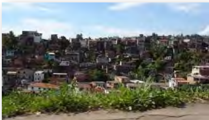
Moradias Precárias - Minas Gerais