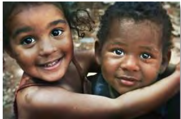
Crianças moradoras de rua.

“os Estados têm o dever de cooperar mutuamente para lograr o desenvolvimento e eliminar os obstáculos ao desenvolvimento. Os Estados devem realizar seus direitos e seus deveres de modo que promovam uma nova ordem econômica internacional baseada na igualdade soberana, a independência, o interesse comum e a cooperação entre todos os Estados, e que fomentem a observância e o desfrute dos direitos humanos.” (ASSEMBLEIA GERAL DAS NAÇÕES UNIDAS, 1986)