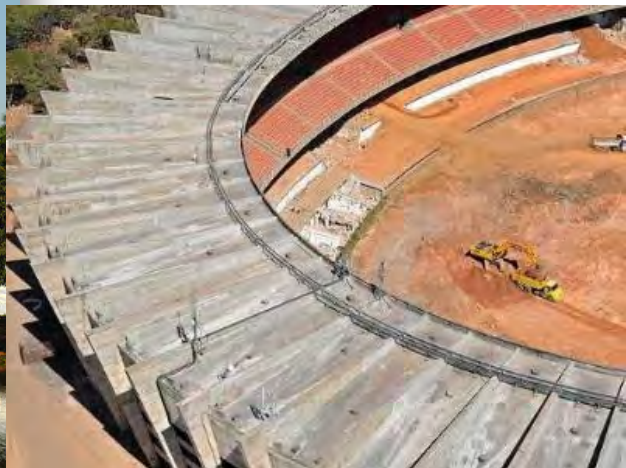
Estádio Governador Magalhães Pinto 'Mineirão': Reforma para receber a Copa do Mundo/2014 - Belo Horizonte.