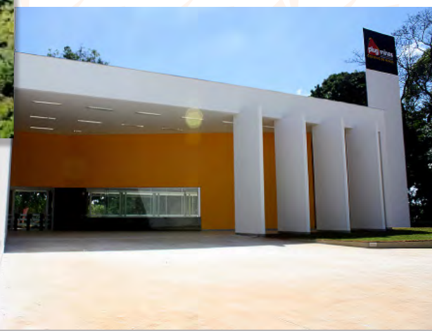
Plug Minas - Minas Gerais