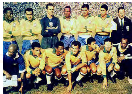
Copa do Mundo de 1962 - Brasil, bicampeão Mundial