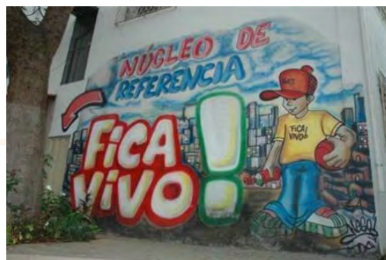
Projeto Fica Vivo (coesão social.)

Entretanto, a implantação destas medidas na região, seguindo as diretrizes do “Consenso de Washington”, mostrou duas vulnerabilidades, conforme estudos do INDES 2 :