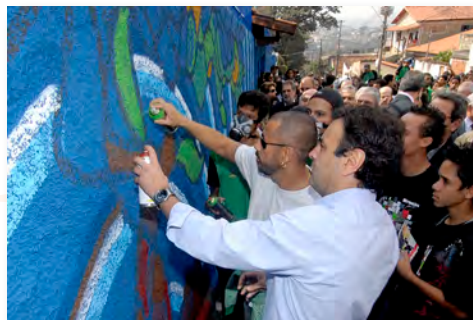
Aécio Neves, Governador de Minas Gerais (2006 - 2009) Em lançamento do Plug Minas (2009)