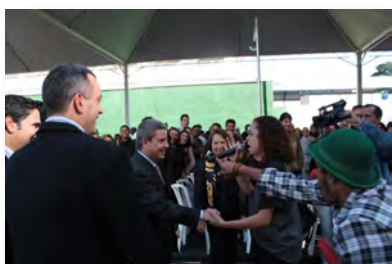
Antonio Anastasia, Governador de Minas Gerais (2010 - 2014). Lançamento do Núcleo Amigo do Professor.(2010)