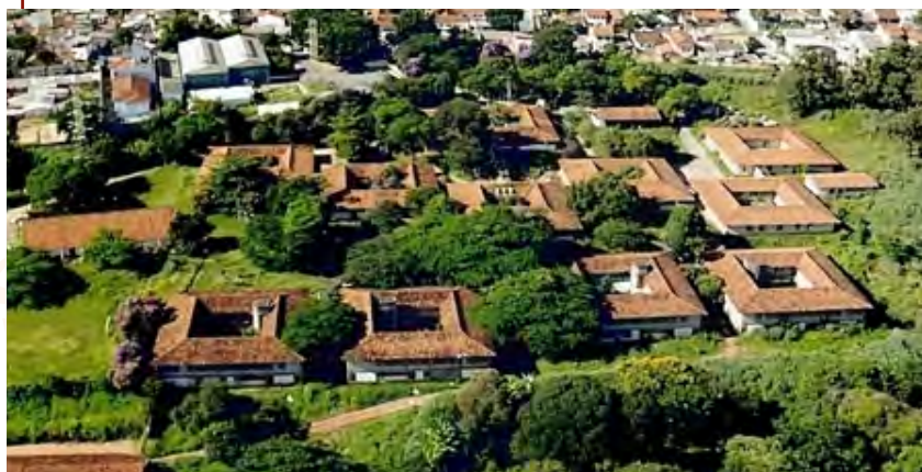
Plug Minas - Minas Gerais

Com o desenvolvimento tecnológico e as exigências cada vez maiores do mundo globalizado e virtual, mister é educar os jovens com ferramentas do século XXI, transformando-os em cidadãos protagonistas e capacitando-os para os desafios profissionais, consolidando aspectos vitais para a cidadania e dignidade humana. A vida em sociedade e o mercado demandam cada vez mais indivíduos e profissionais aptos a responder às respectivas exigências. Gerar desenvolvimento local com coesão social torna-se um grande desafio frente à brutal concorrência nacional e até internacional. Como acentuou Esther del Campo (... , p.41), “El agente público debe provocar contextos de desarrollo, ambientes industriales y espacios de innovación para que la iniciativa privada encuentre atractivas localizaciones para la inversión”.