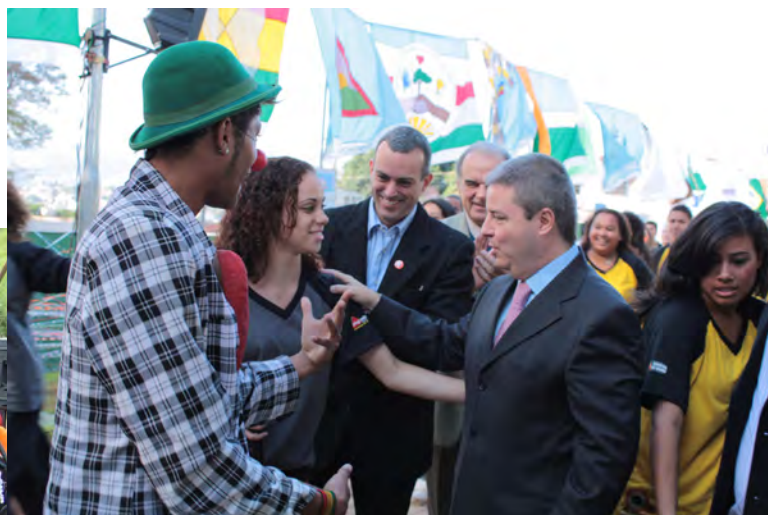
Antonio Anastasia, governador do Estado de Minas Gerais (2010 - 2014) - Visita ao Plug Minas (coesão social).