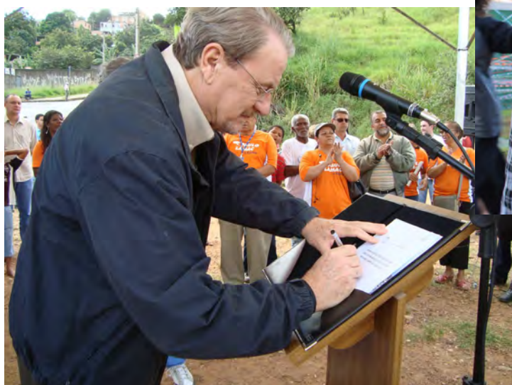
Márcio Lacerda, prefeito da cidade de Belo Horizonte (2009 - 2012) - Assinatura do Orçamento Participativo (coesão social).

Sem dúvida será a inovação social uma importante ferramenta, dentre várias, para a conquista de coesão social em Belo Horizonte, implementando sólidas parcerias e aproveitando ao máximo esta singular oportunidade para a cidade e o país que será a copa de 2014. E, claro, caso o Brasil conquiste o campeonato pela sexta vez, o processo poderá se dar de forma mais rápida e quem sabe também, sustentável e com auto-estima mais elevada.