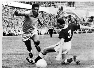
Copa do Mundo de 1958 - Brasil, campeão mundial.