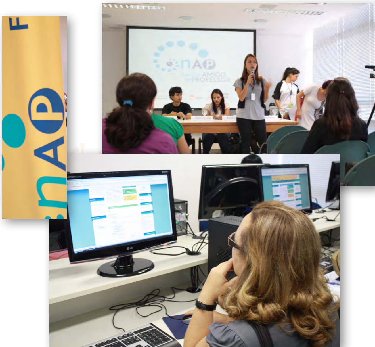
Núcleo Amigo do Professor - Minas Gerais

Núcleo Amigo del Profesor – NAP (INSTITUTO UNIBANCO): En este núcleo se desarrollan actividades de experimentación y disseminación de tecnologías educacionales con el soporte de tecnologías de la información y comunicación, para el perfeccionamiento de las prácticas de educadores y gestores.