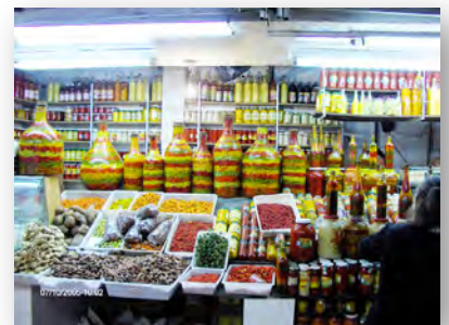
Mercado Central de Belo Horizonte - Minas Gerais