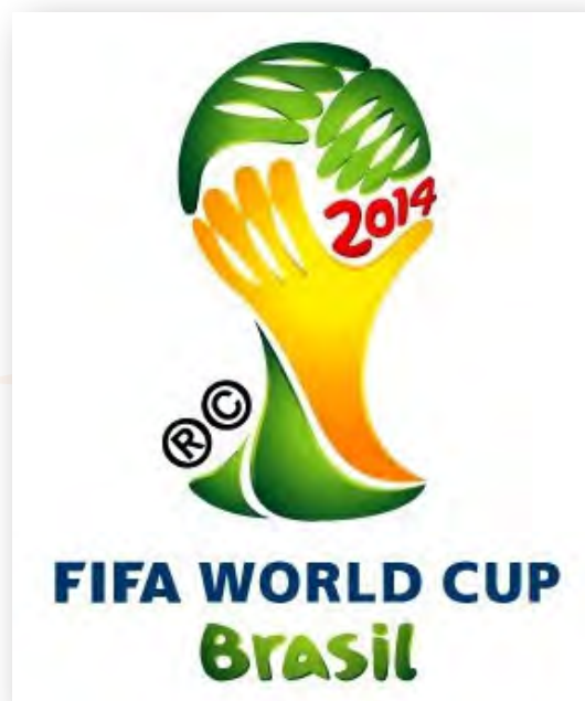
Copa do Mundo 2014 - País sedizador, Brasil

O Informe 2010 da CEPAL dispõe relevantes pontos nucleares a serem observados, ao expor que “uma sociedade que não se educa, que não investe em coesão social, que não inova, que não constrói acordos nem instituições sólidas e estáveis tem poucas possibilidades de prosperar. Ante estes desafios, o Estado deve ser capaz de prover uma gestão estratégica com visão de longo prazo e intervir na formulação do desenvolvimento nacional”.