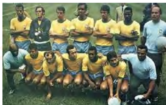
Copa do Mundo de 1970 - Brasil, tricampeão mundial

Em relação aos hotéis, há o planejamento de construção de mais 15 apenas na capital mineira, sem contar os localizados na Região Metropolitana. Serão investidos US$18 milhões em capacitação de até 20 mil profissionais na área de hotelaria, sendo a princípio, apenas neste ano, 500 só em Belo Horizonte.