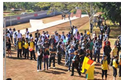
Plug Minas - Belo Horizonte.