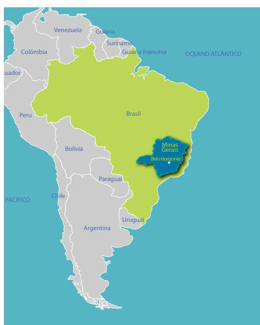
América Latina, Brasil, Minas Gerais, Belo Horizonte.

Não obstante equívocos de gestão, Lula concluiu seu período de oito anos (mandato de quatro anos e uma reeleição) à frente dos destinos do país com cerca de 80% de aprovação, fortalecendo a imagem do país em âmbito internacional, proporcionando pujança econômica, redução da pobreza e elevação de milhares de brasileiros das classes D e E para a classe média.