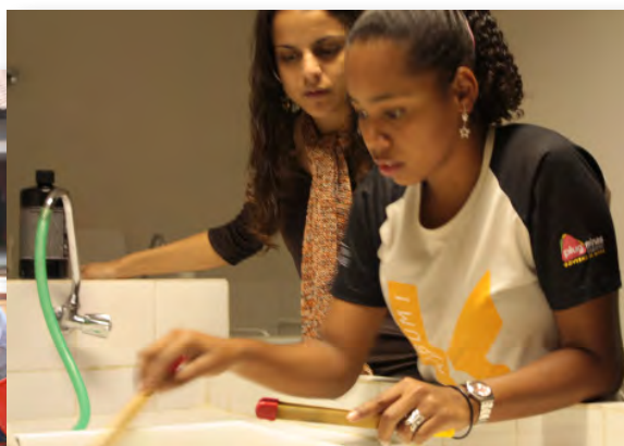
Núcleo Oi Kabum! - Minas Gerais