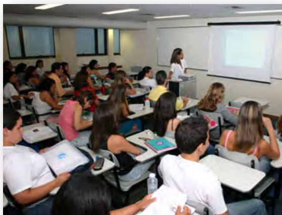
Sala de aula - Brasil