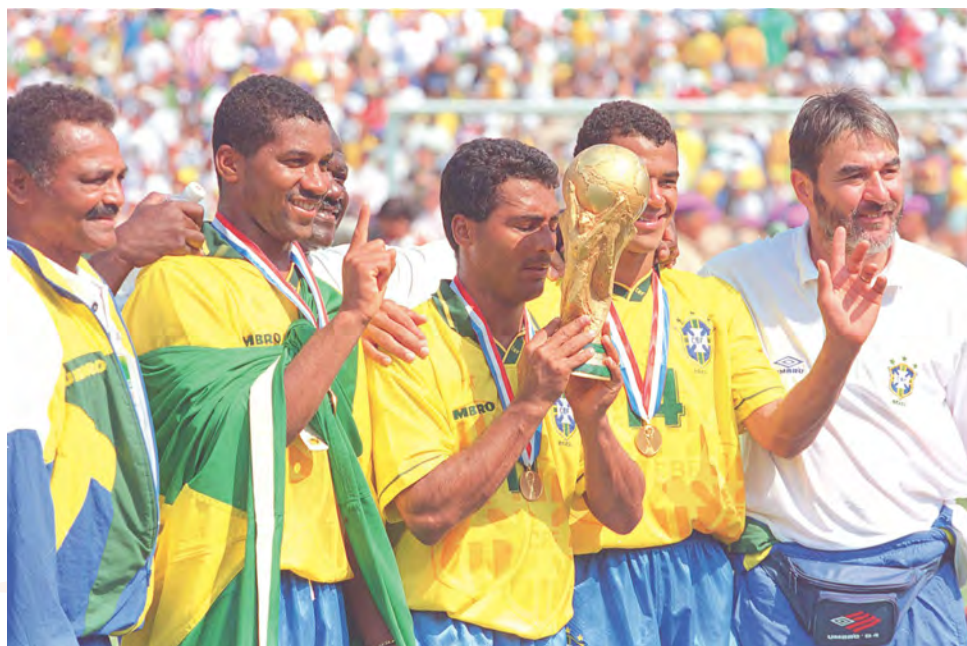
Copa do Mundo de 1994 - Brasil, tetracampeão Mundial

Assim, o pós copa ganha destaque devido às condições favoráveis geradas para a atração de novos eventos, congressos, atividades culturais de âmbito nacional e internacional, feiras e turistas, tanto de negócios como de lazer. Assim sendo, inicia-se com solidez o círculo virtuoso de geração de empregos, aumento da arrecadação de tributos pelo poder público, mais investimentos em políticas públicas, capacitação profissional e infra-estrutura, possibilitando alcançar coesão social, sem desconsiderar em todos os momentos fortalecimento e introdução de elementos de democracia participativa.