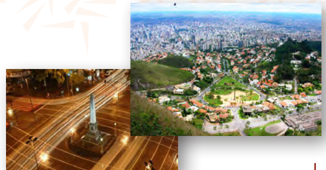
Praças da Cidade de Belo Horizonte - Minas Gerais