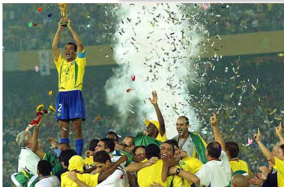
Copa do Mundo de 2002 - Brasil, pentacampeão mundial