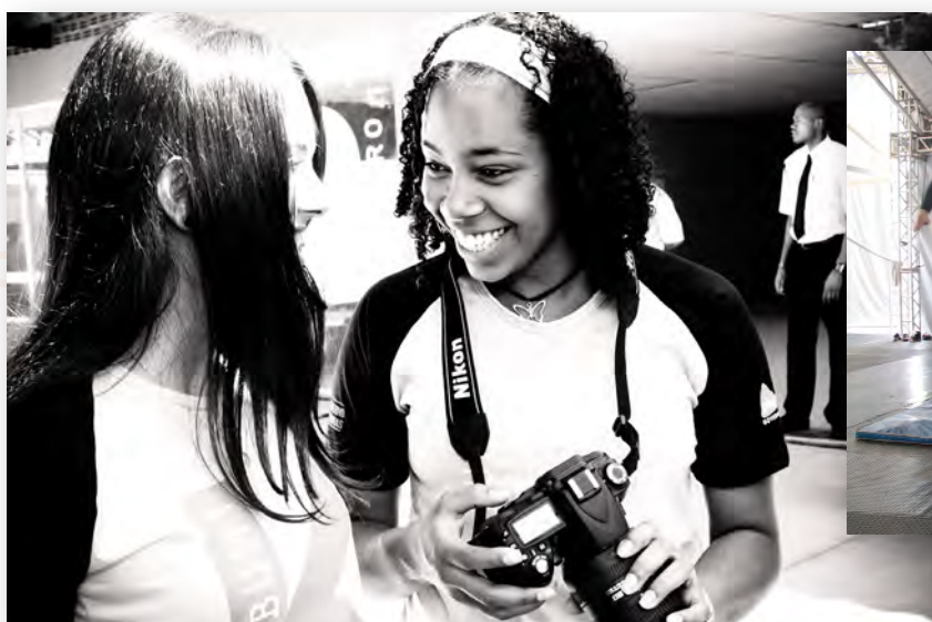
Núcleo Oi Kabum! - Plug Minas.

6Autora do artigo: Plug Minas: a gestão de um projeto social por uma OSCIP em Minas Gerais. (Ano)