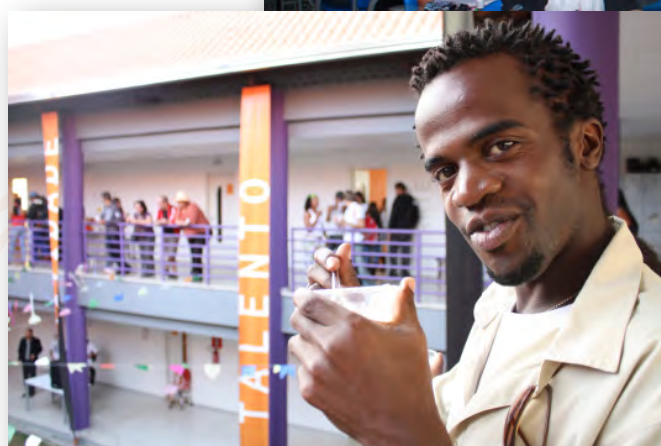
Núcleo Empreendedorismo Juvenil - Minas Gerais